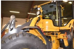
Volvo L120H 750 tim 2019