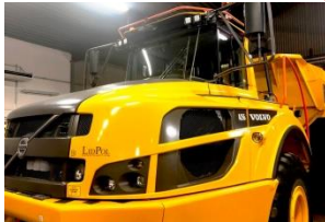
Volvo A25G 4 100 tim 2016 750 hjul