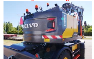
Volvo EWR150E 2020 Miljömotor steg 5

Snabbfäste s6, Hydralliskt snabbfäste, Hammarhydraulik, Slänthydraulik, Griphydraulik, Flytläge, Retur, Knäckbom, Schaktblad, Dubbla verktygsåldor, Skärmar, ATC Air Condition, Radio, Bluetooth, Solskyddsgardin/regnvisir, Luftstol De Luxe med värme, Farthållare, Dubbla torkare fram, 24 kanals centrumsomgång, Centralsmörjning, Tankningspump, Rullspakar, Rullstyrning, Extra arbetsbelysning (typ LED ljus) på bom och sticka, hyttkant fram och motvikt bak + höger sida bakåt + plus vänster sida bakom dörr, Grävbröms, Lastdämpare, Tippputtag enkelverkande och dubbelverkande, Drag, Elkontakt, Dieselvärmare med tidur, Dubbla blinkfyror, Backkamera, Kamera höger sida, Brandsläckare, Förberedd för CareTrack, Instruktionsbok, Reservdelskatalog, Besiktigad, CE-märkt Volvo Original, Miljöpapper, Garanti, Miljömotor steg 5. Kan utrustas med Rotor Engcon EC219 EC Oil, Q-safe med grip, Rotorit R5 med grip. Kan utrustas med maskinstyrningssystem och kan även levereras med eller utan stöben. Kan utrustas med tvillingdäck eller twindäck. Övrig utrustning enligt era önskemål. Undervagn som Volvo EW160E. BM fäste (SPD) kan monteras.