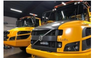
Volvo A30G 4 500 tim 2016